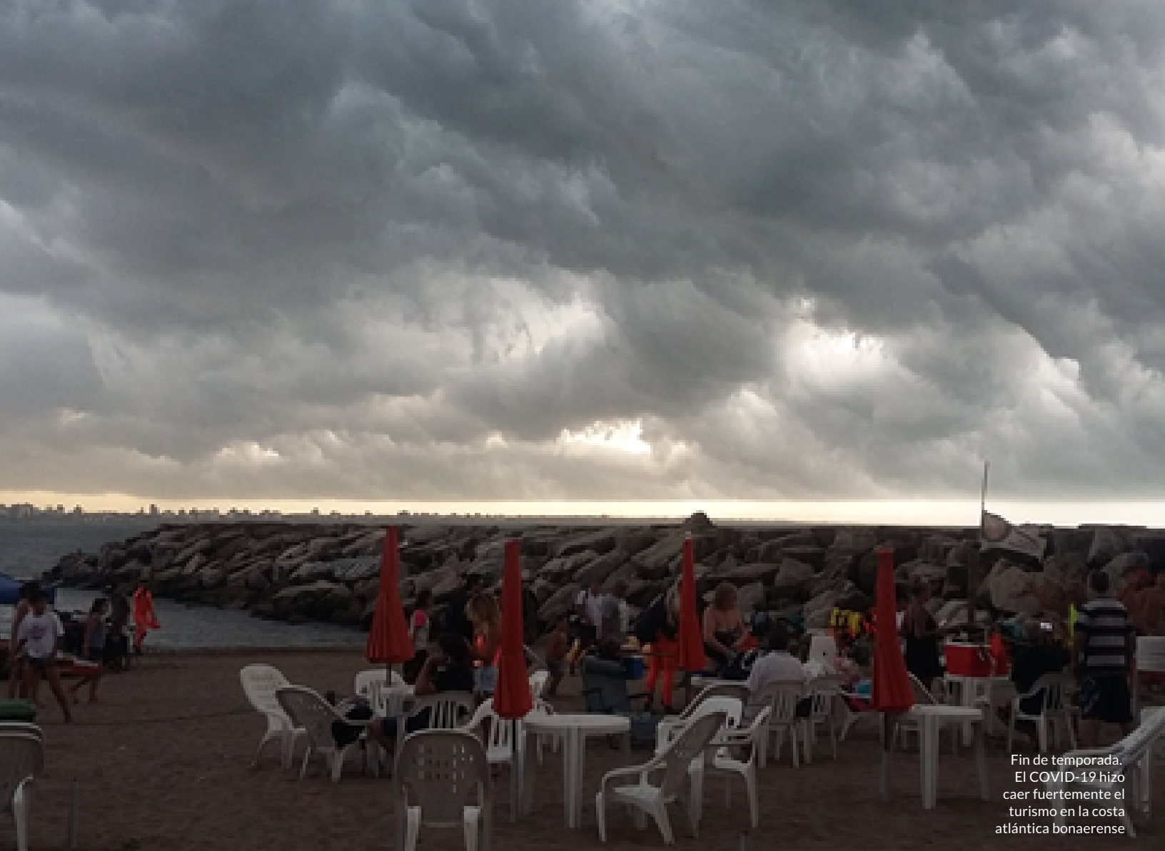
Fin de temporada. El COVID-19 hizo caer fuertemente el turismo en la costa atlántica bonaerense