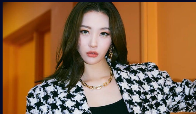
Lee Sumni, más conocida como "Sumni"

Una vez que las compañías eligen, según sus aptitudes y habilidades, aquellos que debutarán como idols , ya sea individualmente o en grupos, se les asigna una personalidad concreta a cada uno: Ser alegre, calmado, misterioso, sexy, tímido, entre otras cualidades. Esto es porque los fans luego eligen a un bias , es decir, un miembro favorito, por lo que la audiencia tiene entre todas estas diversas personalidades y actitudes para elegir. Si el grupo tiene éxito en las primeras semanas, el trabajo y las presiones no concluyen. Los artistas deben mantener una imagen ejemplar, seguir con el peso dispuesto por la empresa y ensayar casi sin parar. Además, deben soportar las presiones de sus fans en redes como Twitter y Weverse, con comentarios como "deberías bajar de peso", "estás más rellena", o "era muy fea la ropa que usaste el otro día". Puede parecer que estos comentarios los hace una minoría, pero lo cierto es que la sociedad coreana en general manifiesta presiones de este tipo, hacia todos sus pares, desde los estudios y el trabajo, hasta de sus cuerpos. Sumni, conocida artista solista, confesó en una entrevista estar bajo una dieta ya que leyó comentarios de sus fans diciendo que "estaba más linda cuando era más delgada" , pero que actualmente mide 1.66m y pesa 49kg, lo que puede llevar a tanto ella como a varios artistas a desórdenes alimenticios.