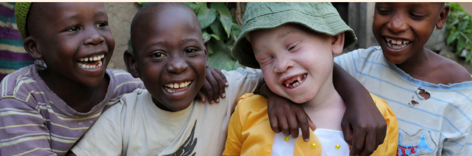
TABLA DE CONTENIDOS