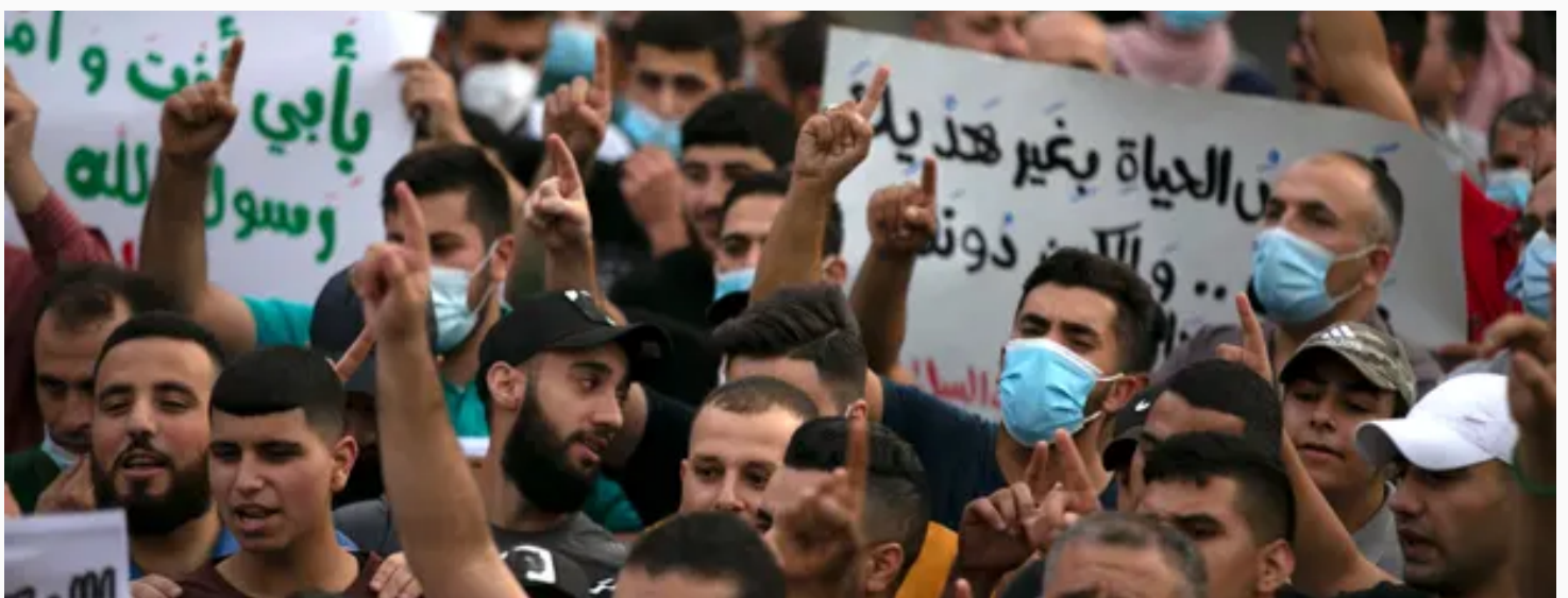
PROTESTAS EN RAMALLAH, PALESTINA, CONTRA LAS DECLARACIONES DE MACRON EL 27 OCTUBRE

TENS OF THOUSANDS OF MUSLIMS PROTEST FRANCE'S 'ISLAMOPHOBIA'