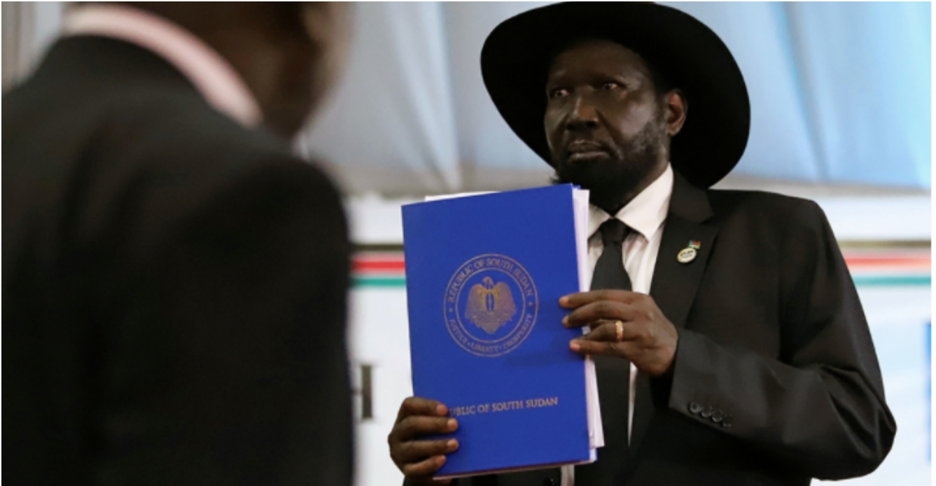
El presidente de Sudán del Sur, Salva Kiir Mayardit con una copia del tratado firmado.