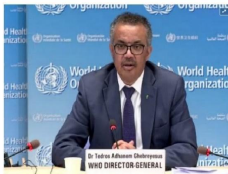
El director general de la OMS, Tedros Adhanom Ghebreyesus.