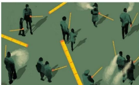
Ilustración: El Herico

Según la Organización Mundial de la Salud, no existen estudios suficientes que sirvan para respaldar que aquellos con anticuerpos pero que no enfermaron sean un vector de contagio