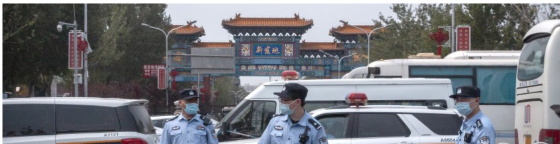
Policías vigilan la entrada del mercado de alimentos de Xinfadi, en Beijing

Pekin extrema las medidas contra rebote del COVID-19