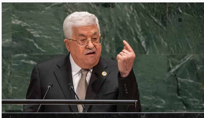
PRESIDENTE PALESTINO MAHMUD ABÁS

En primer lugar, la anexión de los territorios palestinos ocupados es ilegal e ilegítima. Los miembros del Consejo de Seguridad de la ONU (exceptuando a Estados Unidos) así como la Asamblea General, también se oponen unánimemente a él. Debido a esto y que los palestinos quieren que Cisjordania sea parte de un Estado futuro, que consideran ilegales los asentamientos israelíes en ese territorio, y contando con un considerable apoyo de la comunidad internacional, es que esta medida de Israel equivaldría a una grave violación del derecho internacional y socavaría las esperanzas de una solución de dos Estados para el conflicto israelí-palestino. Entonces, ¿Qué tipo de Estado se formaría bajo estas circunstancias?