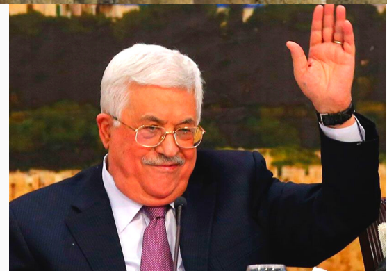
PRESIDENTE PALESTINO MAHMUD ABÁS