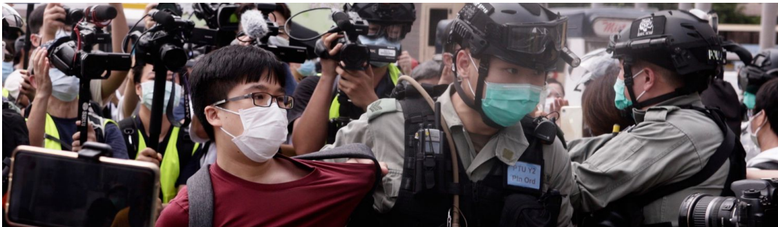
Un policía arresta a un hombre durante una protesta contra el Gobierno, el pasado 10 de mayo, en Hong Kong.

Balkans Not Ready to Declare Victory Over COVID-19