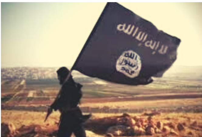
Bandera isis

Sin embargo, al analizar en profundidad la ideología del Estado Islámico y sus motivaciones, entendemos que (más allá de este acuerdo puntual) será casi imposible que acepten una negociación con Estados Unidos, y más aun que decidan detenerse en la búsqueda del conflicto.