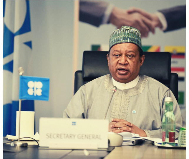
Secretario General de la OPEP, Mohamed Barkindo (@OPECsecretariat)

Luego de largas negociaciones, el 10 de abril se acordó reducir un 23% (10 millones de barriles) de la producción total de petróleo entre mayo y junio, valor que con el correr de los meses irá disminuyendo cada vez más hasta abril del 2021. El objetivo es lograr la estabilización del mercado.