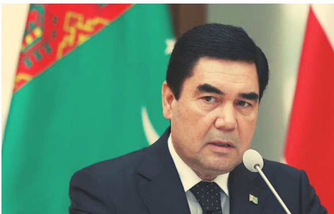
Gurbangulí Berdimujamédov

Esta decisión ha resultado en una fuerte contradicción con las recomendaciones de algunos de los líderes más influyentes del sistema internacional, y aún más ha violado las recomendaciones de la Organización Mundial de la Salud en lo referente al COVID-19.