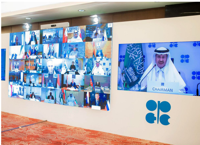
Búsqueda de acuerdo (@OPECsecretariat)

Para que la crisis no siga in crescendo , la Organización de Países Exportadores de Petróleo (OPEP) buscó reducir el impacto de las consecuencias firmando un acuerdo entre los miembros de la organización (Argelia, Angola, Congo, Guinea Ecuatorial, Gabón, Irak, Kuwait, Nigeria, Arabia Saudita y Emiratos Árabes Unidos) y los aliados (Azerbaiyán, Baréin, Brunei, Kazajistán, Malasia, México, Omán, Rusia, Sudán y Sudán del Sur), reconocidos como productores de petróleo independientes No OPEP, también llamados OPEP+. A su vez, hay miembros que suscribieron el acuerdo pero están exentos de las reducciones por sus problemáticas internas: son Venezuela, Irán y Libia.