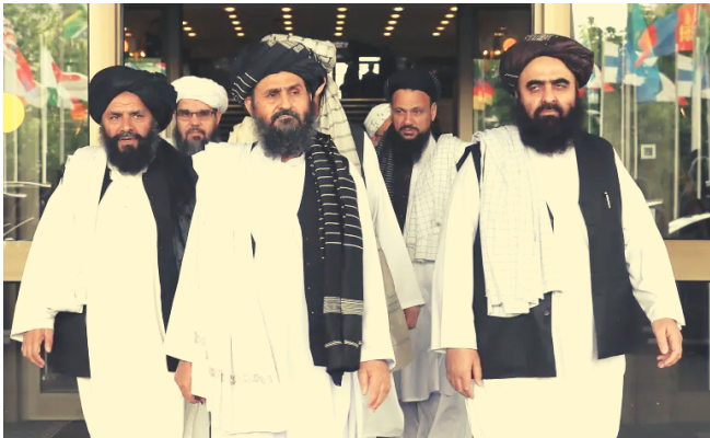
Talibanes saliendo de reunión en Moscú

En esta oportunidad, el ataque se ha centrado en un objetivo dual, un ataque directo a territorio afgano y una demostración de poder frente a los Estados Unidos de América. En este territorio la presencia del movimiento Talibán ha marcado la política interna e internacional en gran medida. El Talibán es reconocido como un grupo extremista compuesto por sujetos y agrupaciones de diversas tribus (en algunas ocasiones sin cohesión de intereses, como es el caso del acuerdo destacado a posteriori), principalmente surgido como respuesta política a la ocupación soviética, de rasgos pastunes y sunníes. Con el tiempo el movimiento fue radicalizándose y convirtiéndose en uno de los representantes más extremo-religiosos del islamismo, su aplicación de la Sharia no ha tenido precedentes.