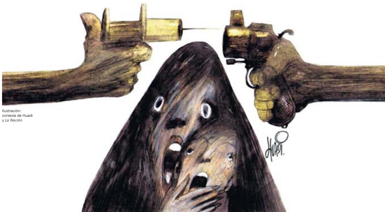
Ilustración: cortesía de Huadi y La Nación

ACADÉMICOS Y GRADUADOS UNIVERSIDAD DE BELGRANO