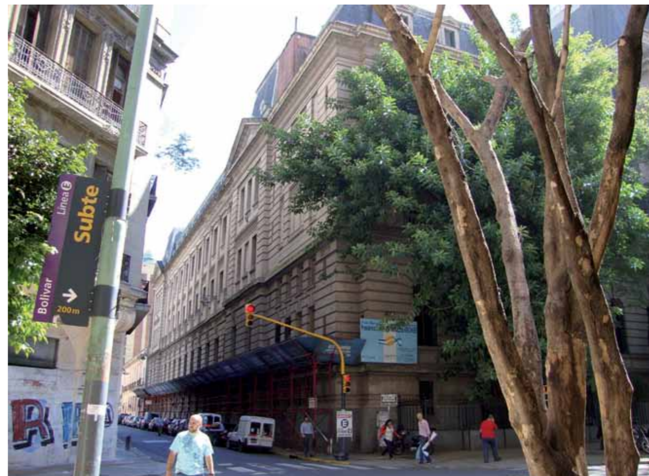
El Colegio Nacional de Buenos Aires, una isla que mantiene contra viento y marea su prestigio en el complejo panorama de la educación secundaria

Una vez más, Sanguinetti volvió sobre su tema central: la disonancia entre las palabras y los hechos. “Ma-