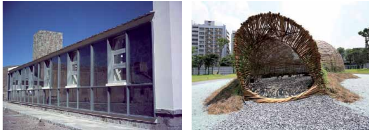
En la página anterior, el edificio de American Express: arriba, el hospital de Susques y una obra del arquitecto Casagrande; en la página de la derecha, el proyecto para lo que será el Museo del Mañana, en Río de Janeiro, y las oficinas de Belgrano Office: en la diversidad, ejemplos de sustentabilidad

son absolutamente obligatorias: paneles solares, aislaciones térmicas, eficiencia energética. En la Argentina, lamentablemente no."