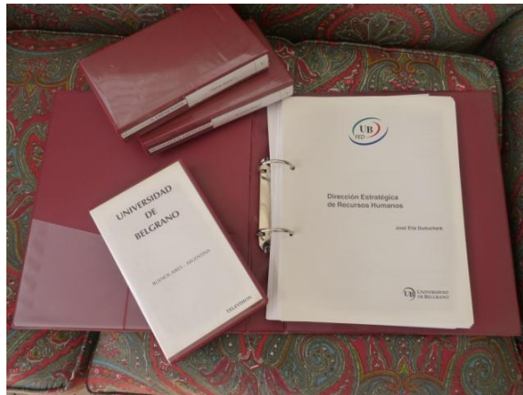
Material impreso. Año 1995.

La base del modelo estaba en los Módulos (Asignatura) impresos y autosuficientes. Un equipo interdisciplinario conformado por un profesor/a (contenidista), diseñador/a didáctico/a y diseñador/a gráfico/a) elaboraban el material de estudio. Cada curso se tipeaba íntegramente con máquinas de escribir y, ante cualquier cambio o modificación introducida por el contenidista, el diseñador didáctico debía retippear el texto modificado. Ese material se enviaba a los talleres gráficos de la Universidad para hacer la “prueba de galera” y, posteriormente, se llevaba a cabo el proceso de impresión. Por ello podemos asegurar que la evolución de la industria tipográfica conjuntamente con la aparición de las primeras computadoras, fueron un hito para la Facultad en cuanto a la producción de sus materiales impresos.