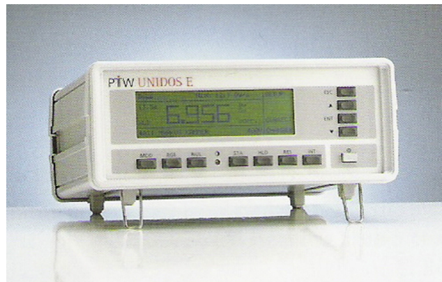
Figura 3 Electrómetro - Dosímetro.

Para las mediciones de dosis, se utilizan maniqués (fantomas) de acrílico compacto. Cuando la cámara lápiz se coloca en aire o en el interior de un fantoma, en posición paralela al eje z de barrido del equipo, y se efectúa un corte por el plano que pasa por el centro de la cámara, esta recoge