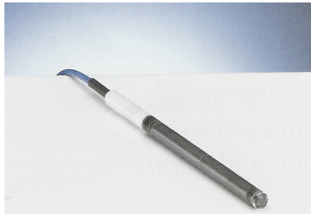
Figura 2 Cámara de ionización tipo lápiz.

siglas en inglés: Computed Tomography Dose Index ), que ha sido definido como: