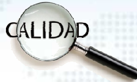
Aseguramiento de la calidad