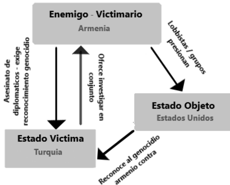
Figura 1b) Imagen Distorsionada difundida por Turquía

Retomando los elementos hallados en los textos, además de rechazar la declaración del presidente Joe Biden, los funcionarios turcos incluyen elementos que posicionan a Armenia como un enemigo de Turquía y como Estado Víctima. Esto busca quitarle credibilidad al reconocimiento del genocidio armenio, y puede tener el posible efecto de que otros actores o individuos creen esta versión y por ello decidan no emplear la palabra genocidio para describir los hechos de 1915. Mediante las respuestas, se configura una imagen distorsionada