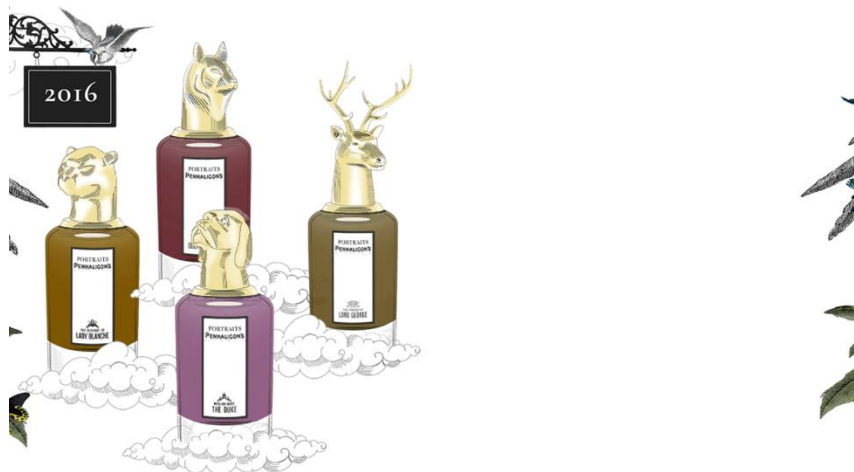
The founding fragrances of the esteemed Portraits family, The Tragedy of Lord George, The Revenge of Lady Blanche, The Coveted Duchess Rose and Much Ado About The Duke take residence in Penhaligon's stores. Scandal ensues.

Un ejemplo de esta creación de historias lo tiene la Marca Penhaligon's, en el 2016 creo la línea "Portraits Family" que consiste en que cada Fragancia caracteriza a diferentes personajes de una familia de la alta sociedad Inglesa que esconden grandes secretos y reina el caos detrás de las puertas.