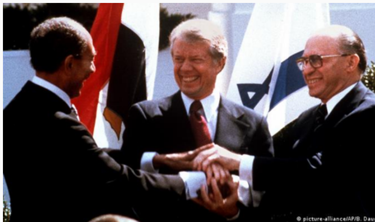
Acuerdos Camp David

La situación egipcia fue particularmente relevante ya que es considerada por muchos historiadores como el primer paso hacia la paz de medio oriente ya que fue el primer Estado arabe en firmar la paz con Israel. Fue además el primero en convocar los 3 nos de Jartum y el primero en romperlos, cambiando la perspectiva hacia la causa palestina al no poner como prioridad los refugiados palestinos. Esto se dio a partir del tratado de Camp David.