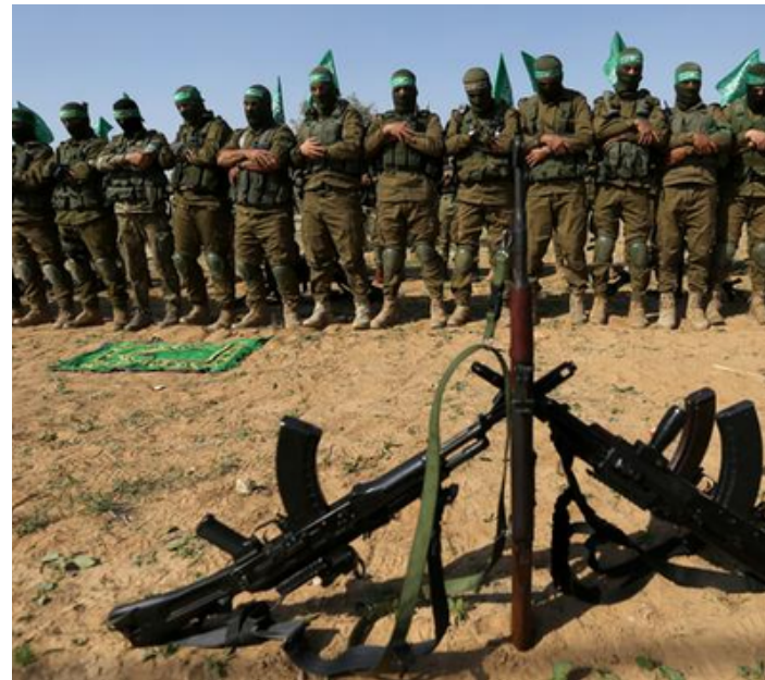
Hamas en un desfile 2009