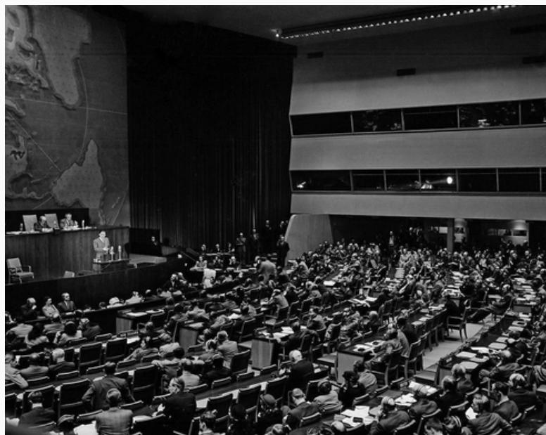
Votación de la ONU

En 1947, tras los intentos fallidos por parte de Gran Bretaña de constituir un Estado binacional en el territorio palestino, delegó el problema a la ONU, quien creó una comisión específica para buscar posibles soluciones. Meses más tarde la misma planteó dos posibles soluciones. La primera, era la creación de un Estado binacional, la cual se probó imposible tras las malas relaciones entre judíos y árabes, por lo que se debería acudir a la segunda opción. Esta consistió en la división del país en dos Estados independientes, uno judío y otro árabe. Por su parte la Ciudad de Jerusalén se establecería como un protectorado de la ONU, siendo así una ciudad internacional a la cual podrían acudir tanto árabes como judíos.