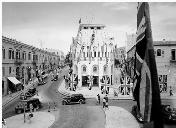
Calle de Jerusalem con banderas británicas

Desde la Primera Guerra Mundial, la tierra disputada por judíos y musulmanes era parte del Protectorado inglés. Este se comprometía a acompañar el proceso de independencia de este territorio, esperando a la cooperación y maduración de ambos grupos. En 1947 diversos conflictos violentos llevaron a la creación de un comité para la resolución del conflicto en el territorio del protectorado, hasta que en noviembre de 1947 la ONU elaboró un plan de partición. Las diferentes posturas de ambos lados presentan, hasta ahora, un problema sin resolver.