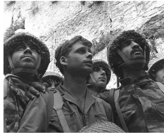
Israel logra ingresar al muro de los lamentos

El yihadismo es una ideología global que pertenece al islam. El mismo pretende restablecer la verdadera religión para luego conquistar el mundo para obtener la salvación. Si bien puede ser entendido como una práctica espiritual religiosa, los grupos extremistas como Hamas buscan en ella un apoyo para la guerra santa. De esta forma se intenta destruir a todas las religiones falsas (es decir todas aquellas fuera del Islam). Hamas, el movimiento Yihadista y distintas agrupaciones extremistas se fundamentan en ella para explicar el intento de destrucción del Estado judío.