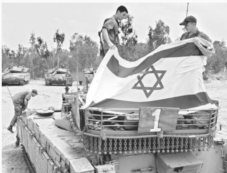
Ejército israelí en la guerra de 1948

El 14 de mayo de 1948, se declaró la independencia del Estado de Israel. Ese mismo día, los países árabes dieron comienzo a una guerra árabe-israelí que duraría hasta el 6 de enero de 1949, denominada Guerra de la Independencia por los israelíes y guerra del nakba por los árabes. Este enfrentamiento, se libró en diferentes frentes de forma simultánea. En el norte, combatió el ejército sirio-libanes junto al ejército de Liberación Árabe, en el centro, la Legión Árabe de Transjordania, las fuerzas de Irak y el Ejército de Liberación Árabe y en el sur, Egipto junto a fuerzas árabes. Todas ellas contra el Estado judío, que a horas de nacer se dividía en distintos frentes, en una guerra que había predicho.