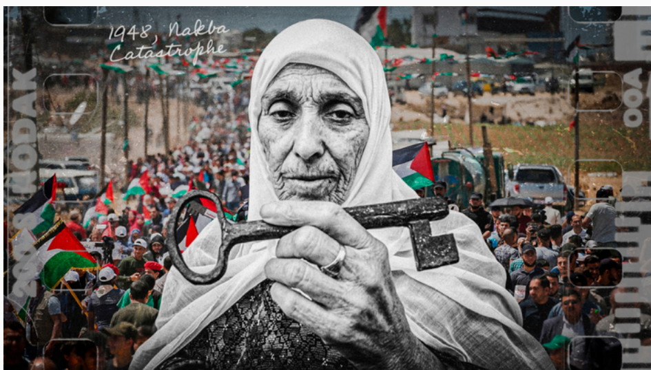
Ilustración de Nakba.

El día de la Nakba, es el día de luto nacional palestino, ya que su desgracia es la creación del Estado de Israel y por eso se celebra el mismo día que los judíos celebran la independencia de su país.