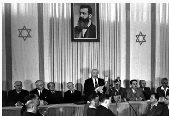
Declaración del Estado de Israel