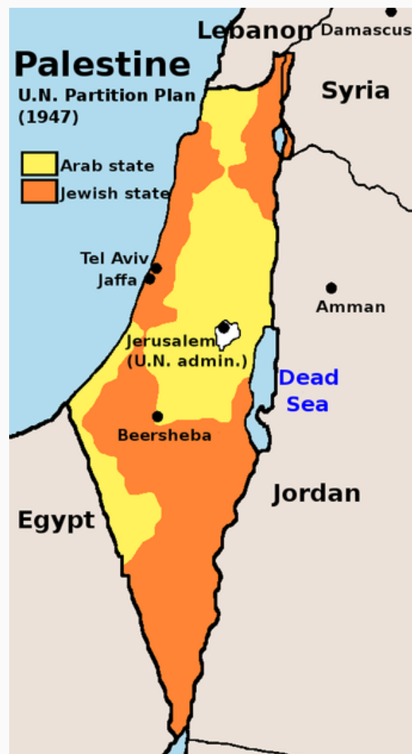
Mapa de partición

Por lo tanto, la primera fase de la guerra civil librada entre palestinos árabes y judíos, comenzaría a fines de noviembre de 1947 y finalizaría a mediados de mayo del próximo año. La segunda fase, a partir de finales de mayo de 1948, con la declaración oficial del Estado judío, se denominará un conflicto multi estatal. El mismo, contrapondrá a los ejércitos del Estado de Israel contra Irak, Siria, Transjordania, Arabia Saudí, Egipto y Líbano.