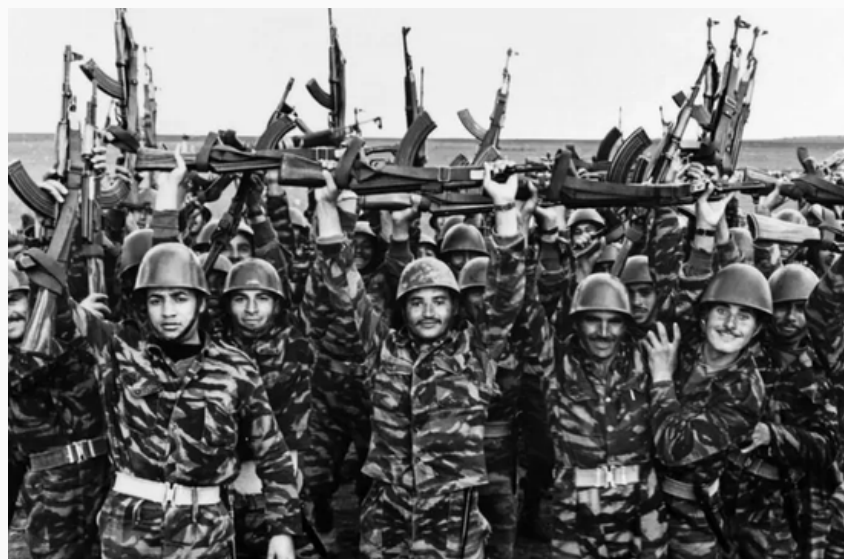
Soldados árabes días previos a la guerra

Durante 1966 los Estados de Egipto y Siria realizaron una alianza militar apoyados por la Unión Soviética, lo que puso en alerta al Estado judío. Meses más tarde, Gamal Abdel Nasser expulsó a las Fuerzas de Emergencia de las Naciones Unidas, movilizand sus tropas junto a las palestinas a la frontera con Israel. De esta forma, el presidente Egipcio, Irak y Jordania acordaron cerrar el estrecho de Tiran, bloqueando el paso a los buques de pabellón israeli. Es así como Israel lo comprendió como una ofensa y movilizó también sus tropas. Ante la inferioridad numérica, Israel consideró necesario un ataque preventivo y de esta forma comenzó el conflicto bélico.