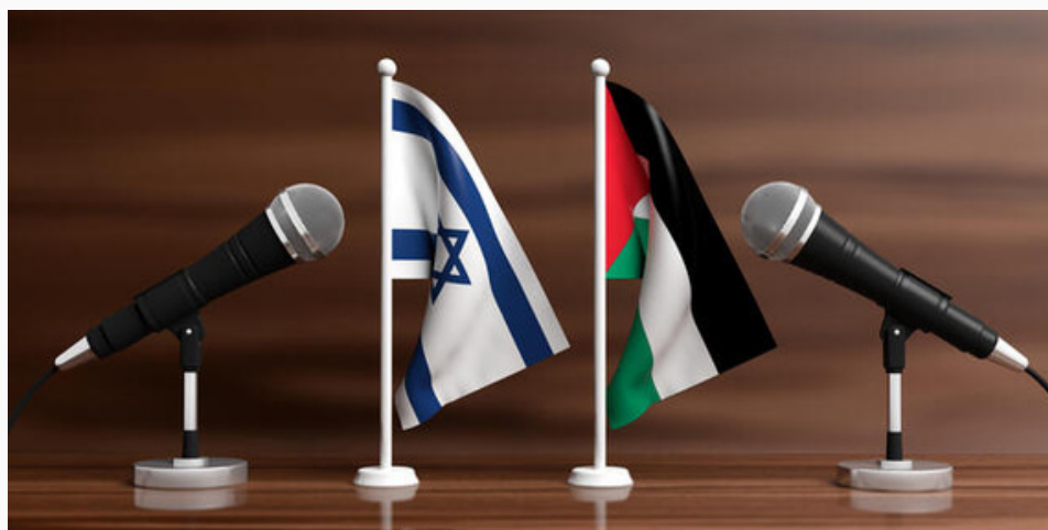
Banderas de Israel y Palestina con microfones