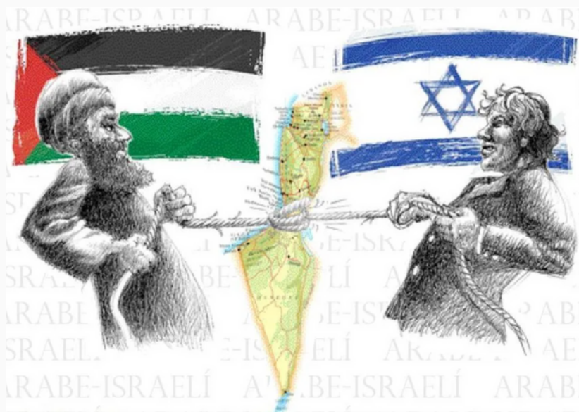
Israel y Palestina en disputa por un mismo territorio

El mandato británico sobre Palestina entró en vigencia oficialmente en 1922, aprobado por la Sociedad de Naciones. El mismo, tenía solamente entre sus pretensiones regir únicamente sobre el territorio palestino, pero los anhelos territoriales para la creación del futuro Estado Judío, expresados en la Organización Sionista Internacional, incluían parte de los territorios de los estados vecinos (Líbano, Siria, Transjordania y Egipto). Además, los árabes tenían serias dudas con respecto a las intenciones de Gran Bretaña de ser el mandatario en esa zona, ya que pensaban que los verdaderos propósitos que poseía dicho país en la región eran colonizar a los pueblos que habitaban allí, en su mayoría de origen árabe