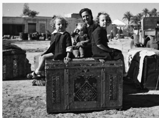
Mu-ujer recién inmigrada sentada en baúles con sus niños