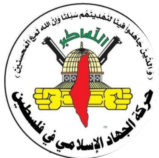
Movimiento de Yihad Islámica Palestina