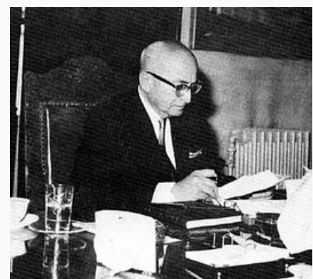
Khalid al-Azm Ex primer ministro sirio